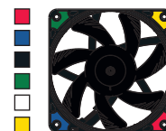
NF-A12x15 PWM chromax.black.swap